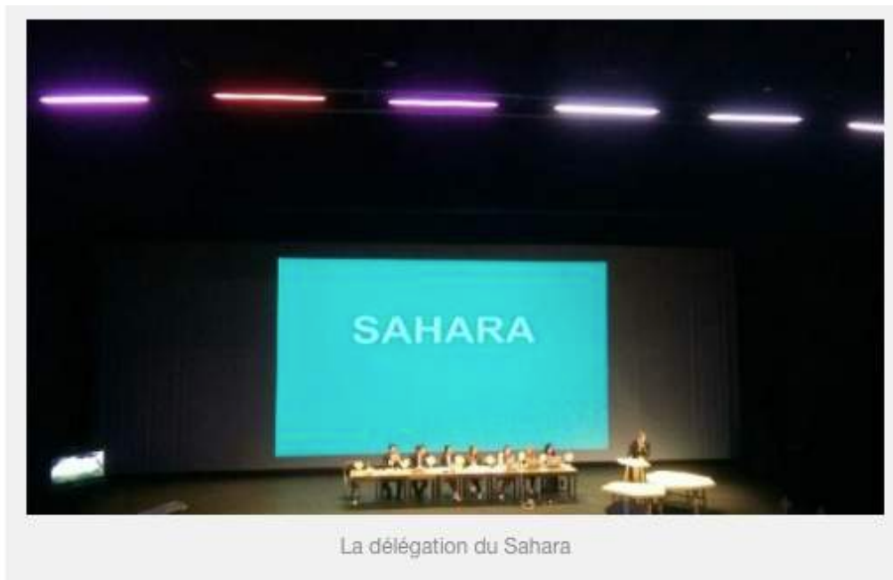
La délégation du Sahara